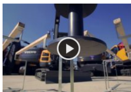
Volvo CE: porte aperte a Mac 3