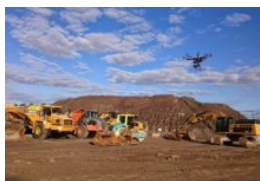
Trimble e Propeller Aero per il pilotaggio remoto