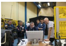
Scania Top Team: al via le selezioni

Articoli correlati Di più dello stesso autore